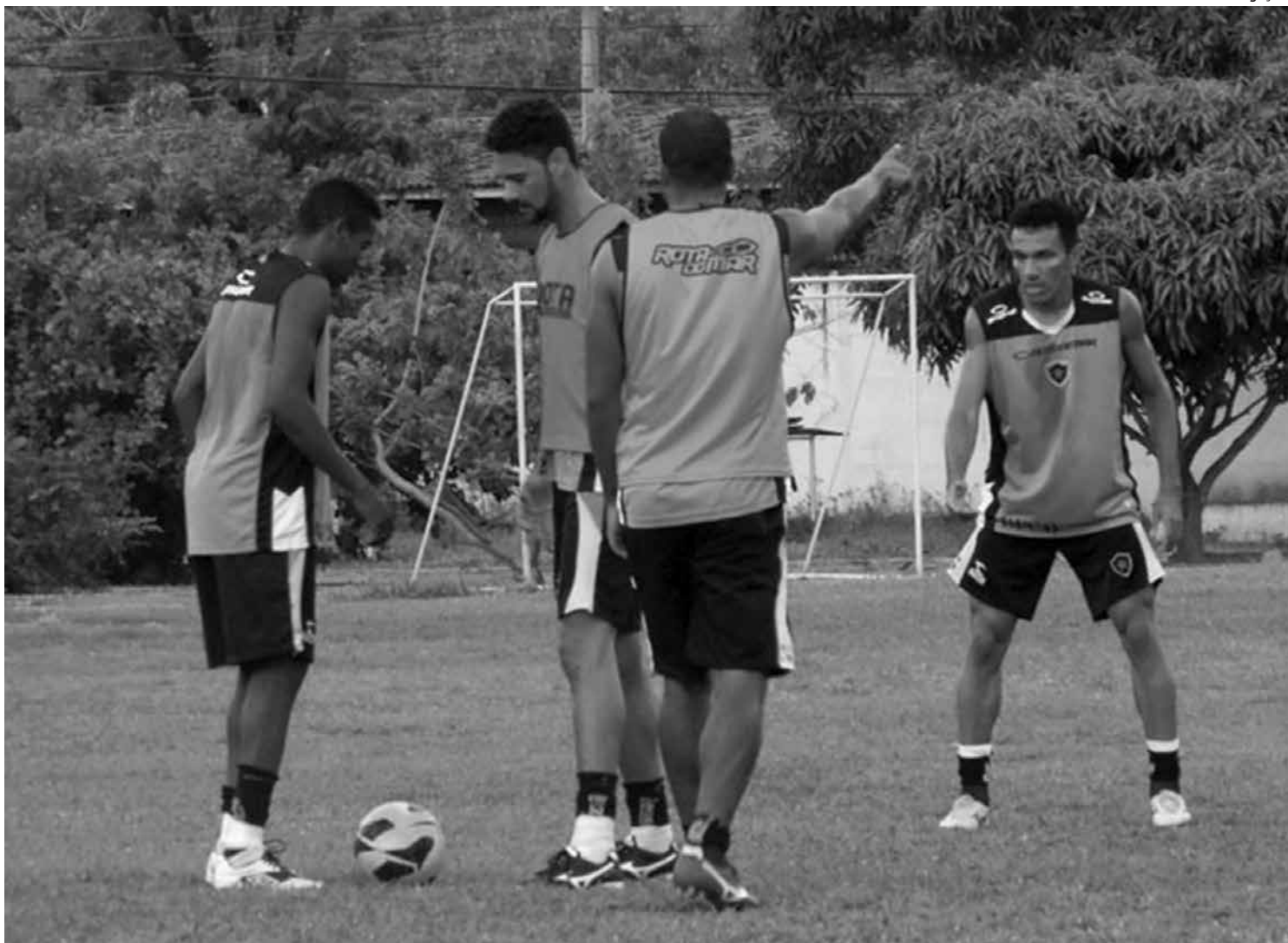
Jogadores do Botafogo durante treinamento visando a partida decisiva de amanhã contra o Central, no Almeidão, pela Série D do Brasileiro

Também durante o encontro, por sugestão da diretoria botafoguense, ficou