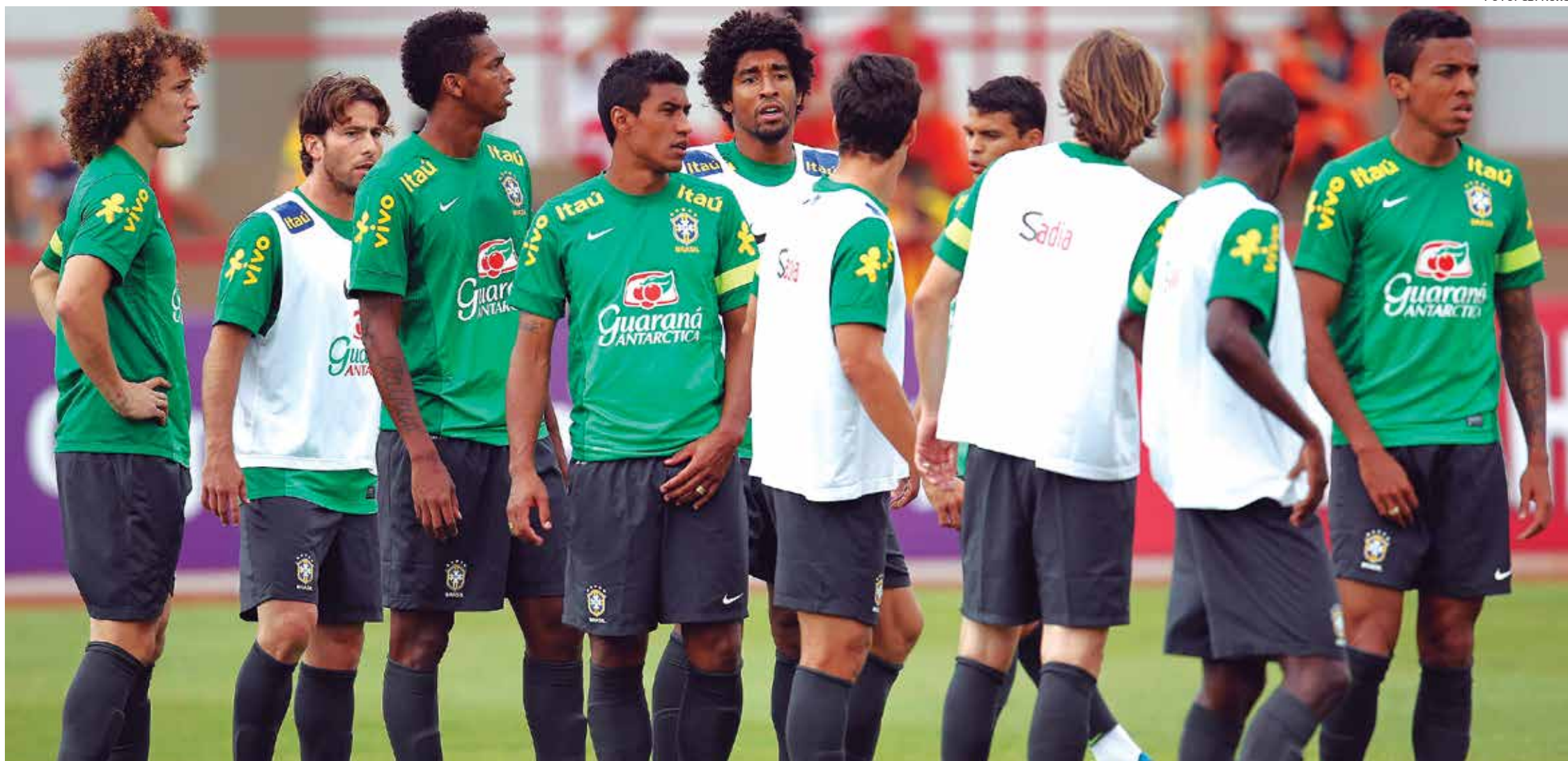
O amistoso contra os australianos servirá, segundo Luiz Felipe Scolari, para testar o Brasil contra uma equipe que tem jogadores altos e costuma jogar na retranca, o que pode se repetir na Copa