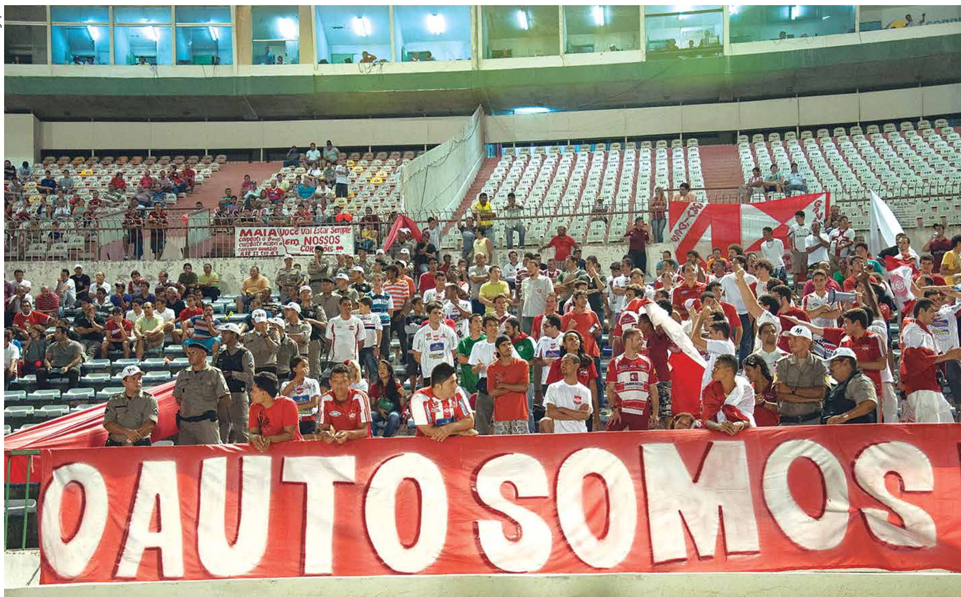
O torcedor do Auto Esporte tem se mostrado fiel ao longo dos anos, mesmo em número pequeno nos estádios. Hoje vai comparecer ao Mangabeirão para a festa

Auto Esporte e Treze deixam o futebol de lado e comemoram os aniversários, hoje, no feriado do Dia da Independência. Fundado no dia 7 de setembro de 1936 o Clube do Povo completará 77 anos, enquanto o Galo da Borborema, estará festejando 88 anos, criado no mesmo dia e mês no ano de 1925. As programações dos times estão definidas com o Treze começando ontem com uma queima de fogos, missa, na Catedral Nossa Senhora da Conceição, além de um coquetel na sala vip do PV, shows da Banda Impacto X e Júnior Dantas.