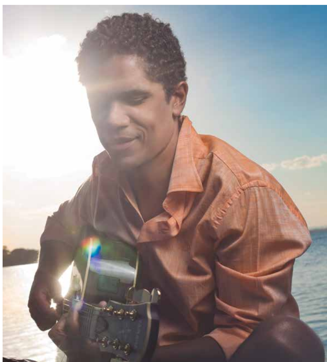
Os Paralamas voltam a João Pessoa com a turnê que comemora as três décadas de carreira em noite que terá também apresentação do Natiruts