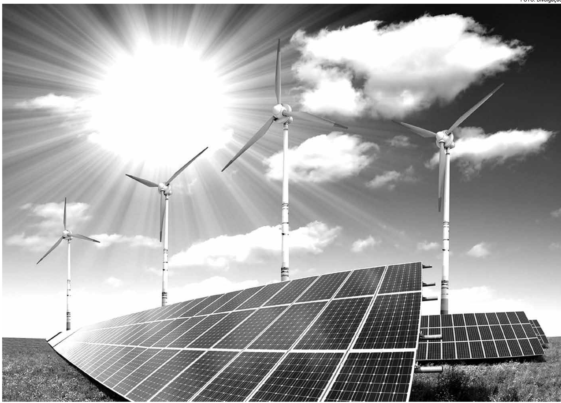
Vários painéis conversores aproveitam a energia térmica da luz solar para a produção energética cujo leilão ocorrerá no dia 18 de novembro

O Estado com o maior número de projetos eólicos é a Bahia, com 199 projetos, totalizando 4.728 MW; seguido pelo Rio Grande do Sul, com 170 projetos e 3.837 MW; Rio Grande do Norte (119 projetos e 2.820 MW); Ceará (66 projetos e 1.539 MW); e Piauí (40 projetos e 1.131 MW). Outros quatro estados vão oferecer projetos eólicos, mas com uma menor capacidade. Também participarão do leilão 15 termelétricas a biomassa, totalizando 504 MW, sendo a maior parte em São Paulo, com 10 projetos e oferta de 346 MW. Haverá ainda oferta de dois projetos de termelétricas a gás natural (469 MW), 16 pequenas centrais hidrelétricas (PCHs) (295 MW), uma hidrelétrica (45 MW) e duas termelétricas a biogás (39 MW). Outras informações podem ser acessadas na página da EPE (www.epe.gov.br).