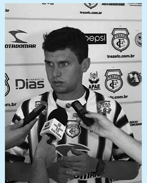
Atacante afirmou que foi “coisa de jogo”

O elenco alvinegro encerra os trabalhos na manhã de hoje com o tradicional recreativo.