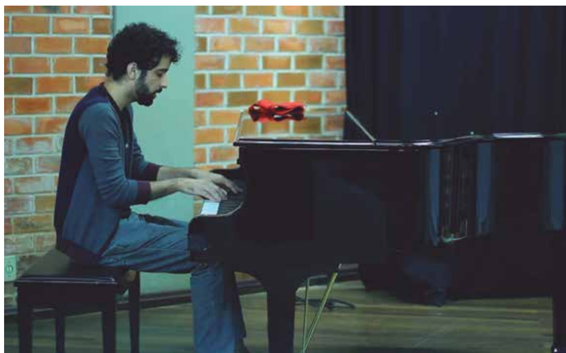
A banda Johnny (no alto) e Grandphone Vancouver estão entre as atrações do evento