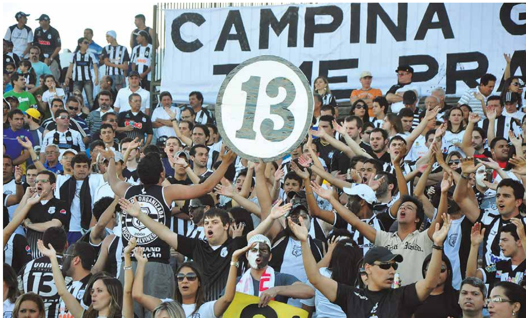
A torcida alvinegra, o maior patrimônio do Treze, tem sempre apoiado o clube nas mais diversas competições, tem motivos de sobra para comemorar hoje