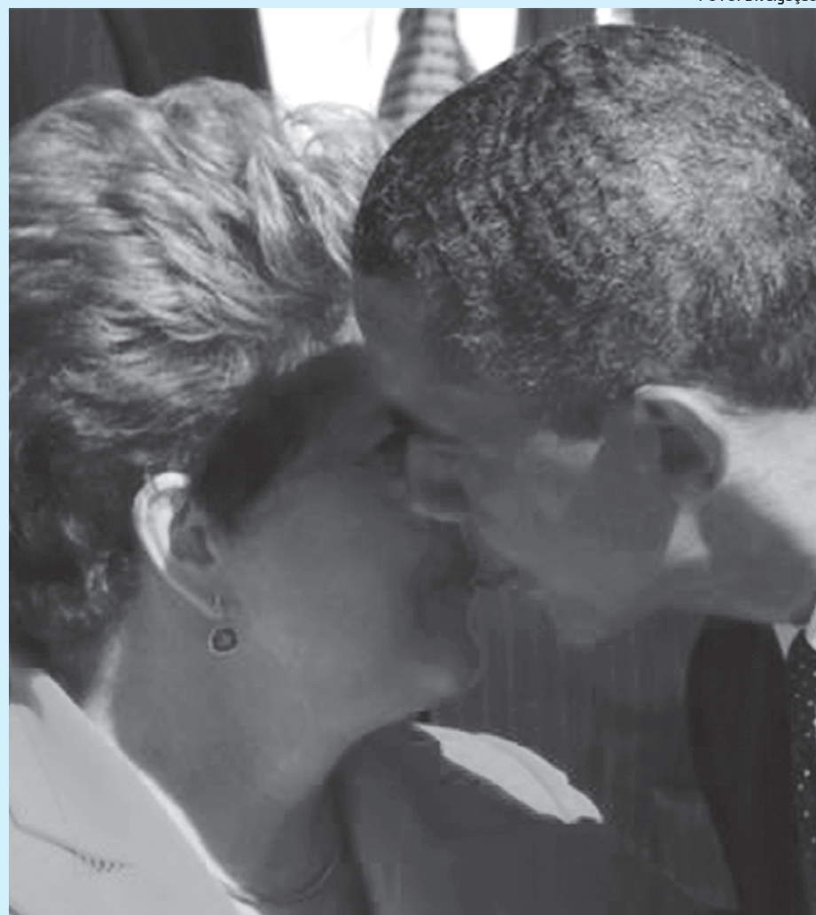
Barack Obama cumprimenta Dilma Rousseff durante a cúpula do G20, na Rússia

"Com a tecnologia mudando tão rapidamente, e as capacidades aumentando ainda mais, é importante que a gente dê um passo atrás e analise o que estamos fazendo, porque, só porque podemos conseguir as informações, não quer dizer