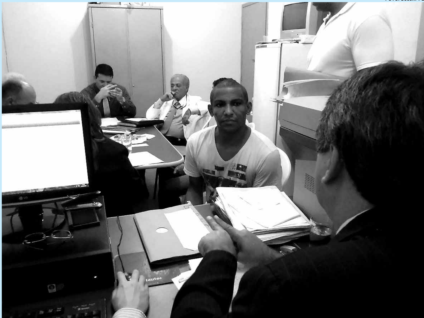
Durante o mutirão foram revisados os processos de 26 reeducandos e discutidos os benefícios da liberdade condicional

Também estão sendo enviados informativos para as Gerências Regionais de Saúde, Secretários de Saúde dos Municípios e Diretores de Serviços, sobre os treinamentos e as orientações necessárias para os demais procedimentos de implantação do Siscan, como por exemplo, a solicitação e a liberação dos acessos ao Sistema.