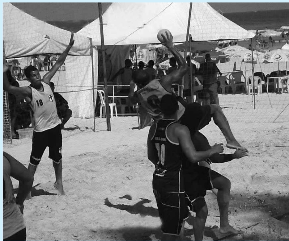
Cinco equipes masculinas e seis femininas vão participar do Circuito Brasileiro